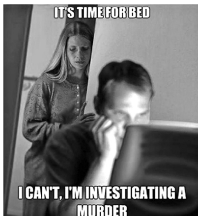
Un meme que refleja el fanatismo forense desatado en torno a Making a Murderer .

En este sentido, el texto es más como un juego. Parcialmente por lo menos, la experiencia de las series de crímenes sin resolver se ha hecho más lúdica porque el fanatismo forense es bastante parecido a un juego: es interactivo, se construye una narrativa y se resuelve (Mittell, 2013). Pero la serie parece a veces presentar una serie de pistas, a veces torpemente, a la vez que plantea que la narrativa debe ser reconstruida pieza por pieza con el fin de lograr una imagen coherente que conduzca a la verdad, algo que en realidad es comple-