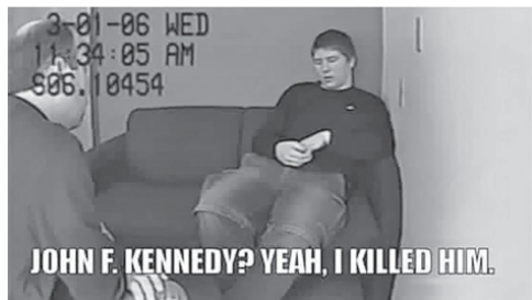
Foto fija remezclada del interrogatorio de Brendan Dassey.

Los autores no aparecen en la serie, pero la voz editorial es evidente en la forma en la que se cuenta la historia: Avery y Dassey son inocentes. Los productores decidieron esto antes de que el público pudiera decidir por sí mismo y esto se hace evidente mediante la forma en que se encuadran las tomas. Esto contrasta con Serial de Koenig, cuyo proceso editorial es obvio, pero genuinamente parece dejar preguntas sin responder. Ambas historias