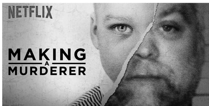
Publicidad de Making a Murderer .